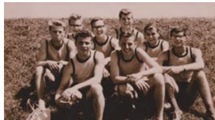
Die erste Jugendmannschaft von 1962.