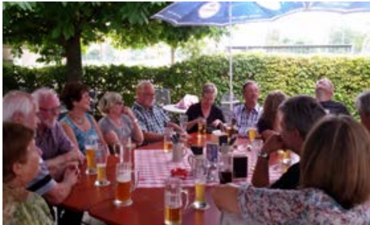
40 Jahre Abteilung Leichtathletik

Die Abteilung Leichtathletik feiert in diesem Sommer ihr 40-jähriges Bestehen als Abteilung. Viele Athleten von früher versammeln sich an der TSV Gaststätte und verbringen einen gemütlichen Abend.